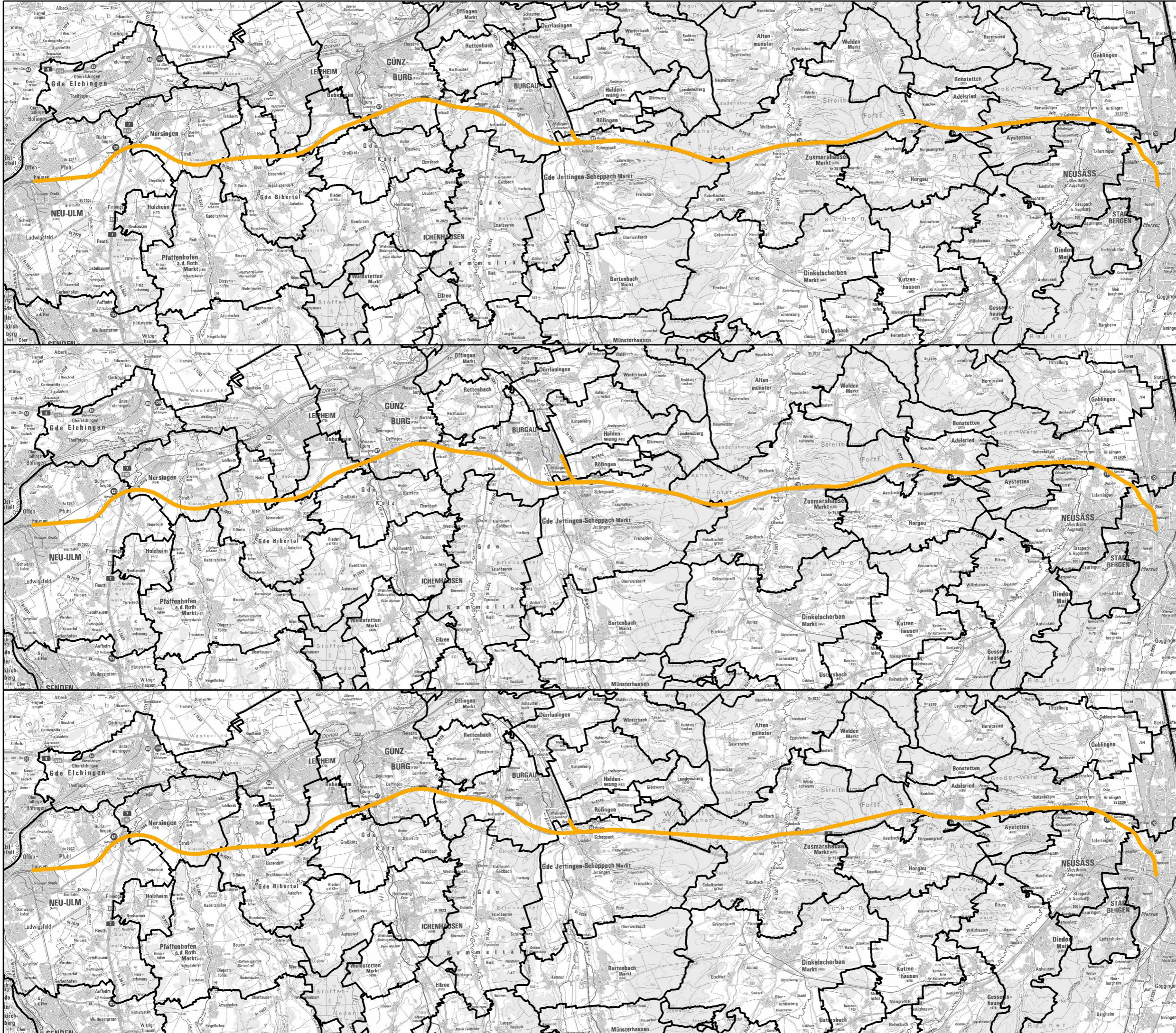
— Variante Orange Enge Bündelung A8