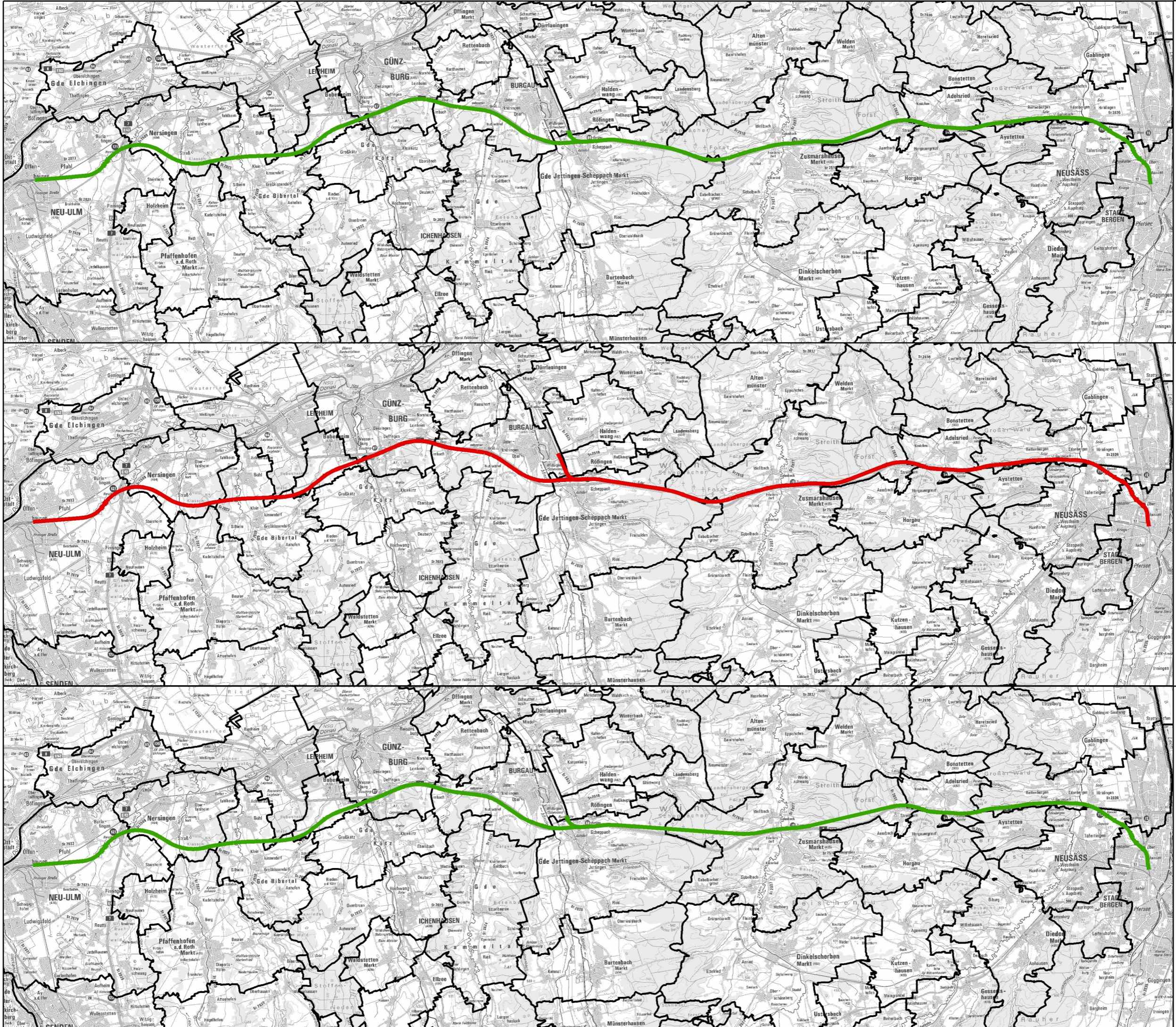
Variante Orange Tiefbahnhof Zusamtal